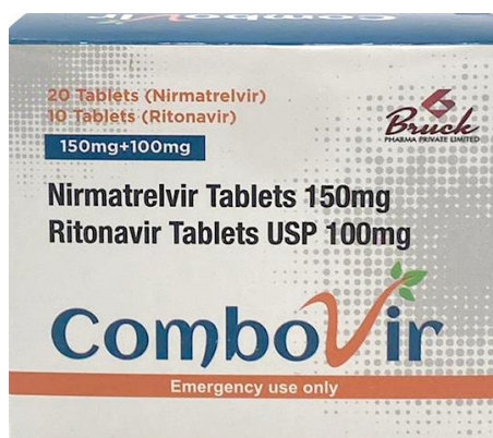
Imagen del producto comercializado de forma ilegal:

Cabe mencionar que la comercialización del producto a través de páginas de internet, plataformas de venta y redes sociales potencializa el riesgo, ya que existe una alta probabilidad de que se trate de productos falsificados, alterados, adulterados o contaminados.